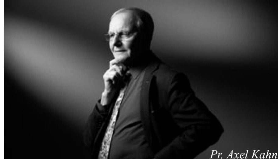
Pr. Axel Kahn

Le 1er RARE démarre le 8 octobre 2016 de Bordeaux. 450 Riders et 80 Roses (femmes ayant été atteintes d'un cancer du sein) partent pour une balade d'1h30 dans l'arrière pays Bordelais direction le Château de Carbonnieux Grand Cru Classé . La société Grand Angle Production réalise une vidéo totalisant plus de 12 000 vues .