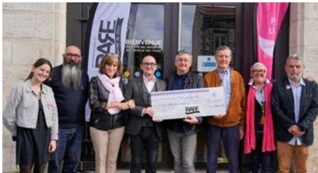
Remise d'un chèque à la Ligue contre le Cancer en 2022